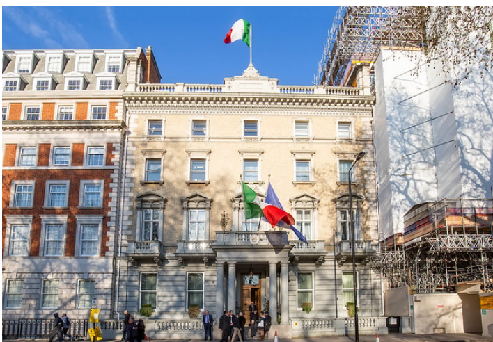
L'ambasciata italiana a Londra

Lo spettro di un no deal mette in dubbio il ruolo di trampolino di lancio di Londra e del Regno Unito per le aziende innovative in Europa. Ma la capitale inglese cerca di reinventarsi per attrarre innovatori